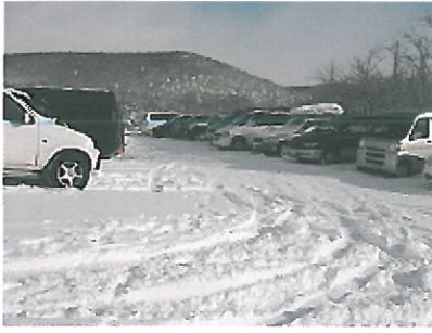
各地から車で集合