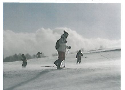
全員無事に帰ってきました