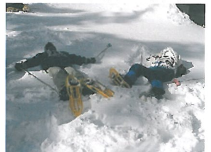
疲れた 雪の上にダウン