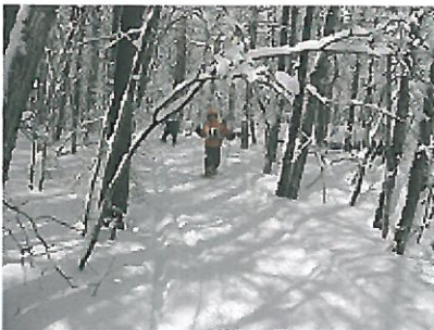
幻想的な森の中をトレッキング