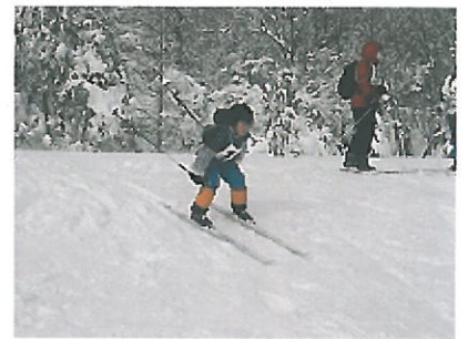
子どもの上達は早い