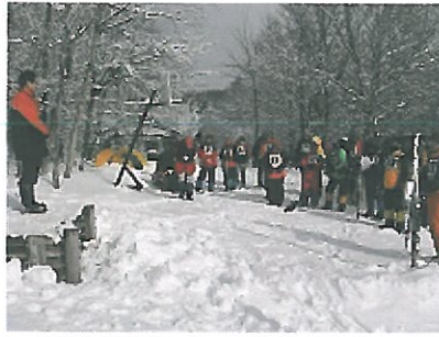
南蔵王青少年野営場からの説明