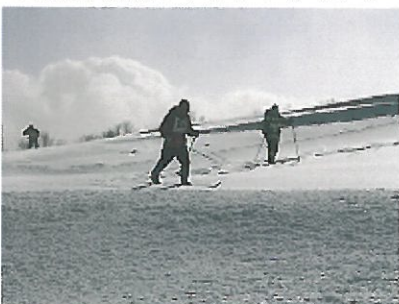
軽やかに 歩くスキー