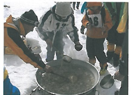
蔵王の地鶏を使った名物鍋