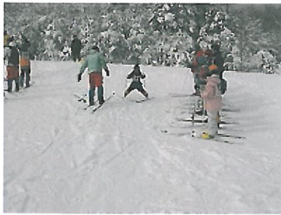
歩くスキーの練習