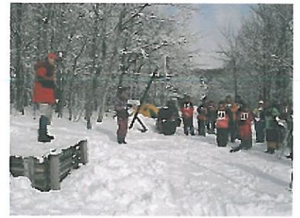
太田事務局長の挨拶