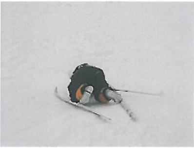
新雪に頭から転倒