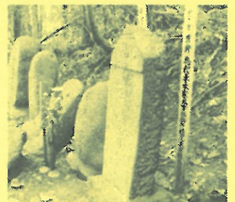
我妻佐渡墓碑 (イメージ)