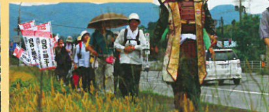
※掲載画像は『真田ウォーキングチャレンジ白石to蔵王! vol.1』開催状況です