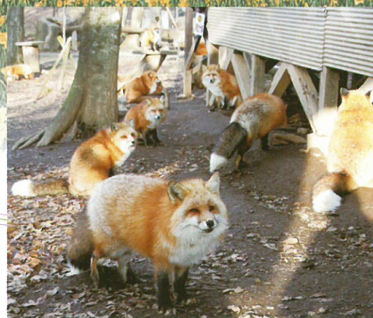
みやぎざおうきつねむら

除雪によって蔵王エコーラインの道路の両側に8m以上にもなる雪の壁が出現。青い空と白い雪の神秘的な回廊をドライブできます。